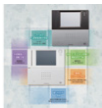
入退室管理 SAN next