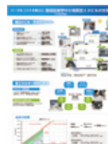
その他 パネル展示