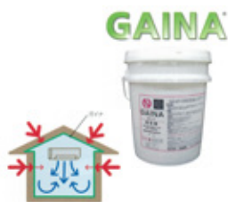
断熱セラミック塗材 ガイナ (GAINA)