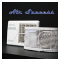
低濃度オゾン発生装置 エアーサクセス